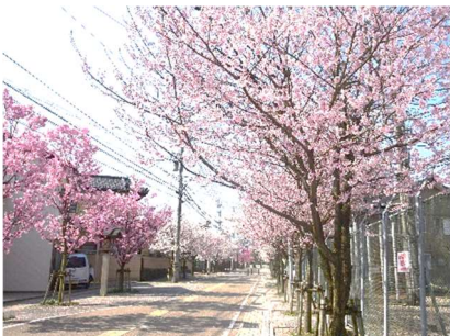
△桜並木の神明通り