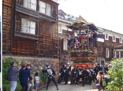
△城端曳山祭 蔵回廊前