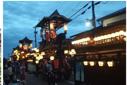
△城端曳山祭 提灯山