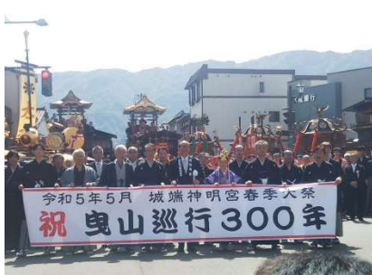
△曳山巡行 300 年 出発式

参加した方も見学された方も皆、にこやかな顔つきで、宵祭・本祭と城端のまちなかは、活気ついていました。