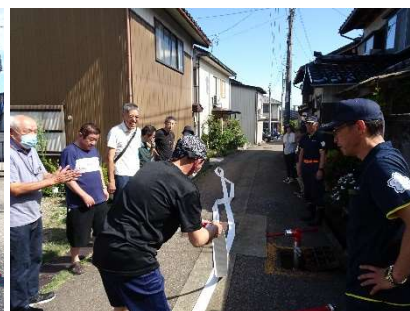
△ 消火栓取扱訓練中