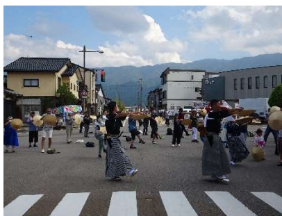
△ むぎや踊り講習会