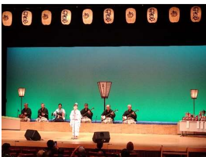
△ 麦屋節コンクール全国大会