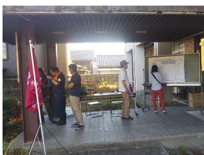
△ 自主避難訓練本部 集計中