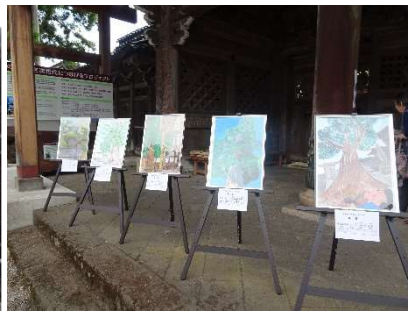
△ 小学生写生大会 大賞作品