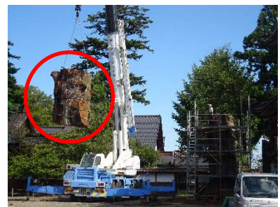
△ 伐採された幹の運搬