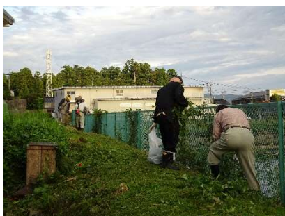
△ 草刈り・回収作業