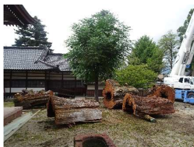
△ 伐採された 幹部