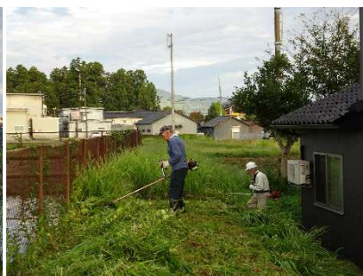
△ 草刈り・回収作業