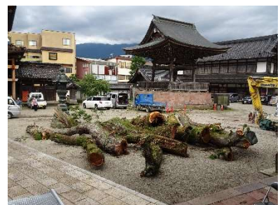
△ 伐採された 枝部