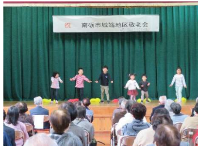
「城端さくら保育園」による遊戯