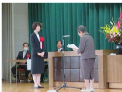
「敬老会代表」による謝辞

次に、「五箇山深山会」11名による五箇山民謡舞踊6曲とメンバーによる歌謡舞踊を鑑賞しました。参加された方々も一緒に歌いながら楽しい時間を過ごしました。