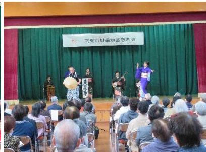
五箇山深山会による五箇山民謡舞踊