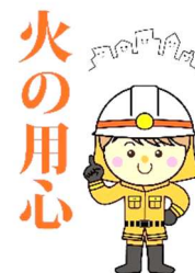
表 砺波地域消防組合管内 火災件数

現在、消防車両による「カンカン」と警鐘を鳴らしながらの地域巡回を行い、火災予防を啓発しています。火の用心につとめ、火災を防ぎましょう！