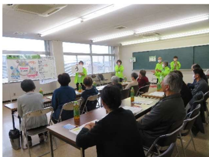
フレイルチェックの様子①