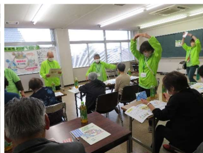
フレイルチェックの様子②