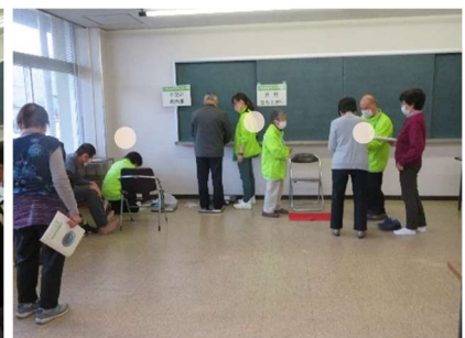
フレイルチェックの様子③