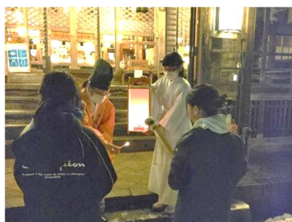
△城端神明社からの神火

左義長：小正月に行なわれる火祭の行事で、長い竹を組んで円錐状の左義長を作り、そこに松の内で役目を終えた正月のしめ飾りや門松、旧年のお札やお守り、書初め等を炊き上げ、無病息災、学業成就、家内安全を願うものです。