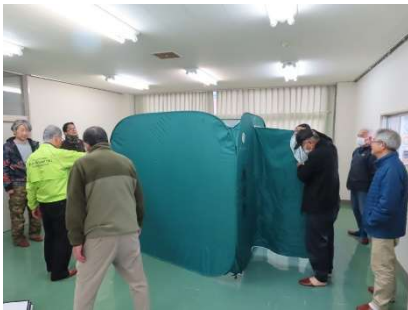
△ワンタッチパーテーション