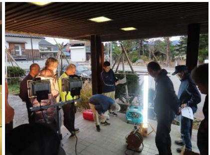
△発電機、照明器の稼働確認